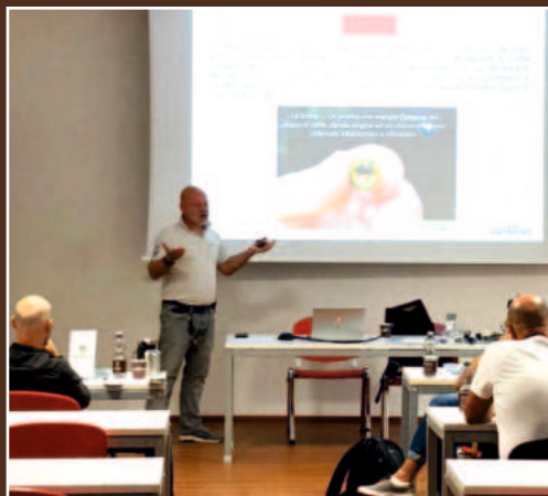
Training in de klas van Costadoro Academy