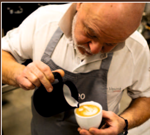
Oefenen in het lab van de Costadoro Academie

Costadoro hecht het grootste belang aan het opleiden van professionals en het verspreiden van de Cultuur van Koffie door het organiseren van één op één lessen, speciale evenementen en praktijkproeven. De toegewijde cursussen bieden verschillende trainingsniveaus, waarbij alle onderwerpen en disciplines aan bod komen: basis koffiezetten, koffie sensorische evaluatie, koffiezetten, latte art, marketing en management. Het is ook mogelijk om IAC- en SCA-examens af te leggen voor erkende kwalificaties zoals het koffiëproeversbrevet of de internationale certificeringen van het Coffee Diploma System.