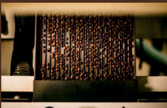
De innovatieve SORTEX Z + 1BL machine.